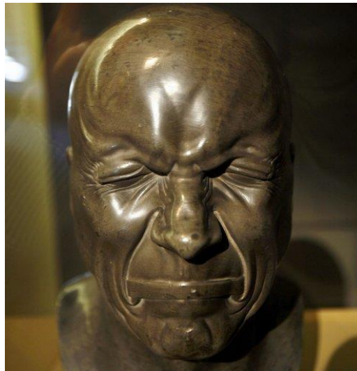
Franz Xaver Messerschmidt