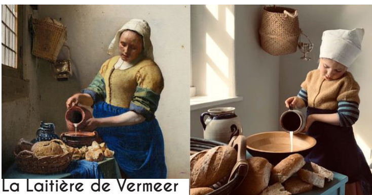
La Laitière de Vermeer