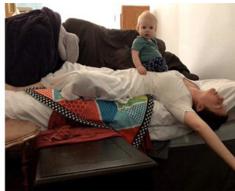
Le cauchemar de Füssli

Voyage Arts Graphiques au Benelux 2018. Les élèves avaient joué le jeu !