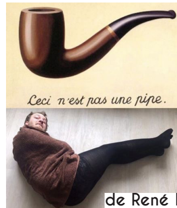
de René Magritte