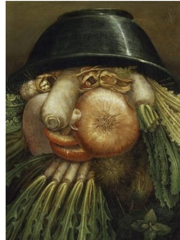
L'homme potager, Giuseppe Arcimboldo, 1590.