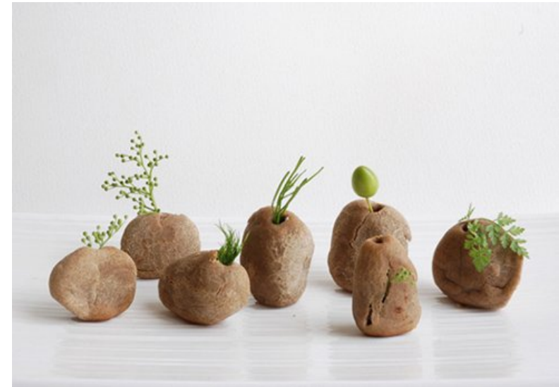
Galets Pain, Yuan Yuan, 2010.