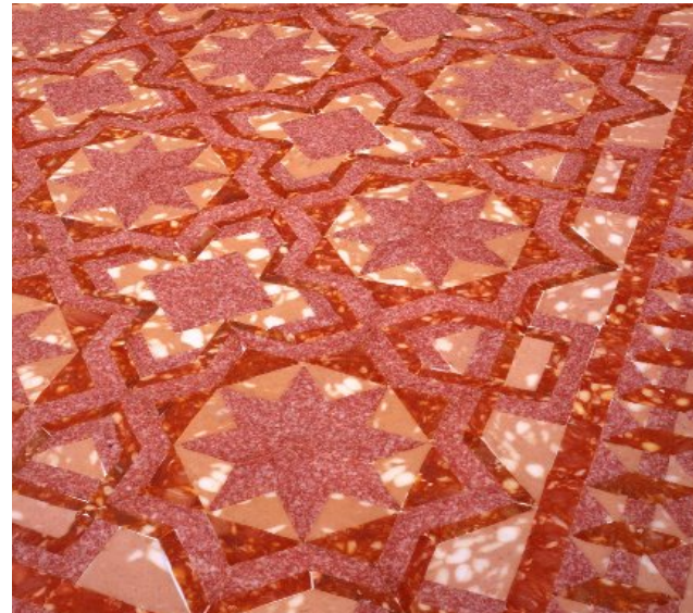
Marble Floor # 93, Wim Delvoye, 1999.