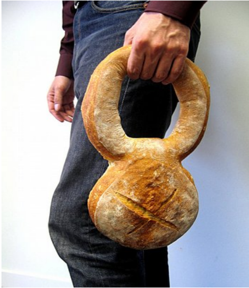
Pain Bis, Stéphane Bureau, 2009.