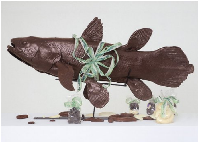
Célébrations, Le gentil garçon, 2005.