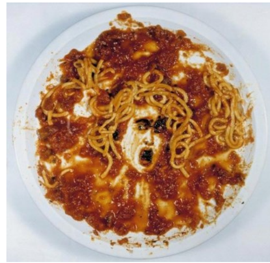
Vik Muniz, Medusa Marinara, 1997.