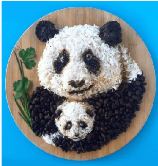
Panda plate, Meal Prepper, 2018.