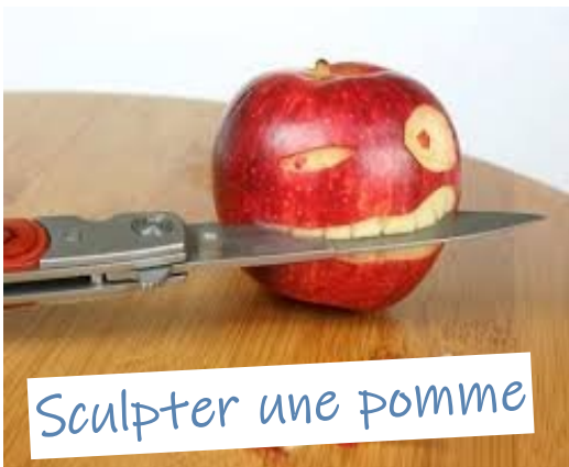
Sculpter une pomme

Quels sont les fruits et légumes du moment