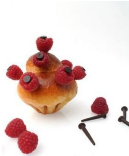
Clous en chocolat, Stéphane Bureau, 2007.