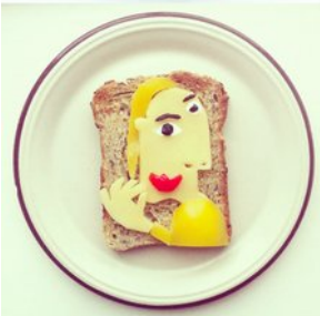
The Art Toast Project, Ida Skivenes, 2013.