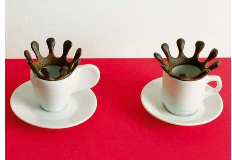
Coffee Drop Splash, biscuit, Radi Designer, 1994.