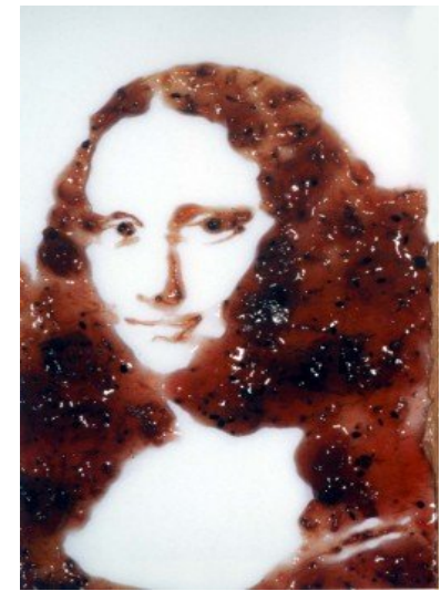
Vik Muniz, La Joconde en confiture, 1999.