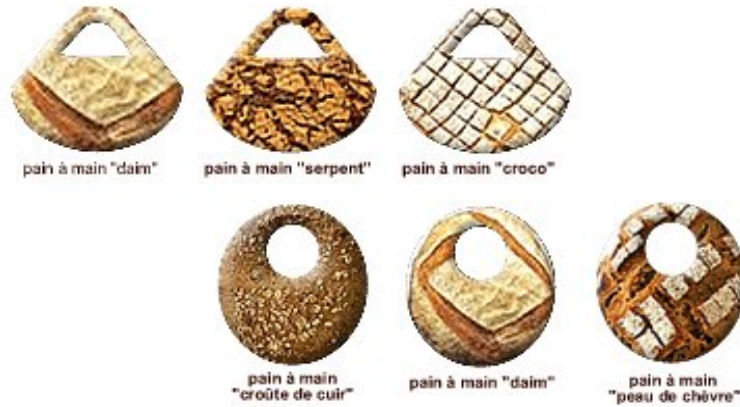
Pain à main, Emanuelle Benoît, 2009.