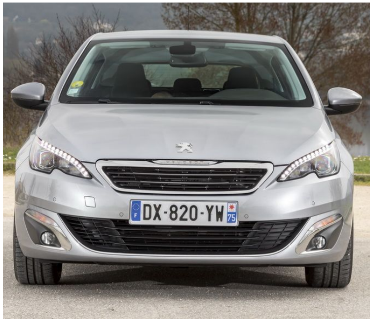
Face restylée en 2017